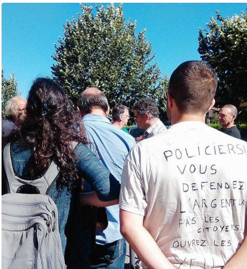
1- Les membres de la ZAD ont distribué des tracts et des croissants pour ouvrir la discussion avec les passants. 2- Le maire Philippe Barthès n'a pas souhaité répondre aux questions des opposants au nouveau parc éolien. L'utilisation de l'article, la reproduction, la diffusion est interdite - LMRS - (c) Copyright Journal La Marseillaise

Écrit par La Marseillaise | mercredi 20 juillet 2016 08:30 | Imprimer